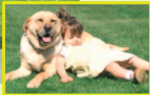
Découvrir une compagnie animale tout en respectant l'espace public : un apprentissage de la citoyenneté.

De plus en plus de propriétaires de chiens prennent conscience de la nécessité de ramasser les déjections de leur animal. Pour aider ce comportement citoyen, la Ville et Nantes Métropole mettent en place des canisites et distributeurs de sacs, pour une campagne de sensibilisation de 3 mois, de mi-juin à mi-septembre.