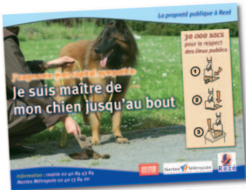
L'affiche de la campagne.

Le sujet a été évoqué dans les conseils consultatifs de quartier de Pont-Rousseau, de Trentemoult et de la Blordière (lire ci-contre) parce qu'il touche l'espace public, ce bien commun que tout le monde s'efforce d'embellir et de protéger pour y vivre en bonne intelligence.