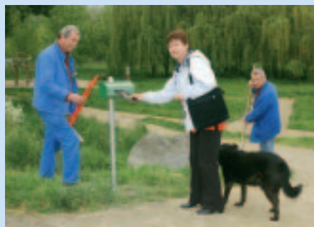
Installation d'un distributeur de sacs, parking de la Barbonnerie.

Par ailleurs, une vingtaine de magasins volontaires et de lieux publics proposeront gratuitement des sacs dans des distributeurs mis à disposition par la Ville.