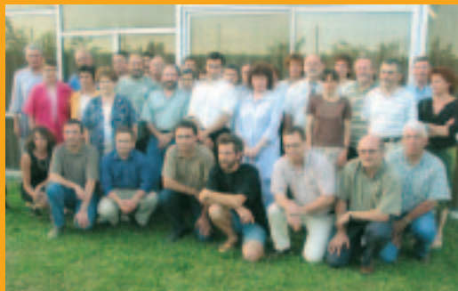
Le conseil consultatif du quartier Jaunais-Blordière (mandat 2002-2004).

Le Conseil consultatif de Jaunais-Blordière s'est intéressé de près à la propreté publique. Il a demandé au Pôle de la Communauté urbaine Nantes Métropole et à la Ville une présentation du fonctionnement de leurs services.