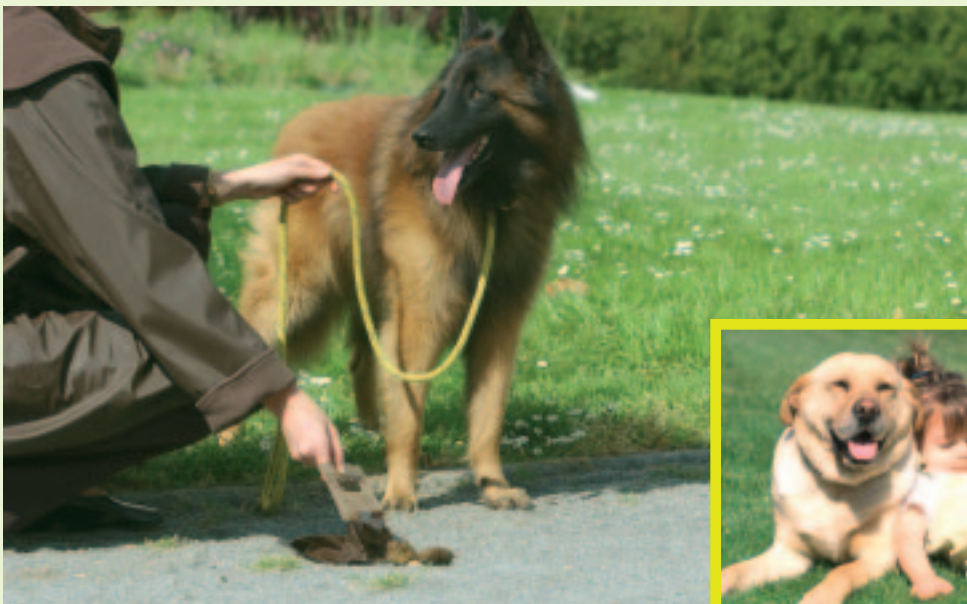
Être responsable de son chien en toutes circonstances, c'est s'assurer le respect des autres habitants.